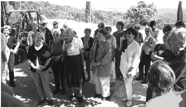
... in den Hügeln des Chianti ...

Auf Siena folgt eine Weindegustation: – Brancaia – in den Hügeln des Chianti erwartet uns, und damit ein Wein von allererster Güte, aber auch die Erkenntnis, dass die Weinherstellung harte Arbeit ist und, wie immer, wenn Grosses entstehen soll, Lust und Liebe sowie viel Kreativität hinzukommen müssen.