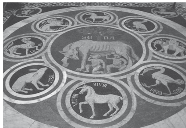
Detail vom Boden im Dom von Siena

Über Pienza fahren wir nach Siena. Die Stadt liegt nicht nur rosenrot auf dem Hügel, sie ist die Erhabene, mit dem wohl schönsten Platz der Welt, dem Campo. Gibt es eine Steigerung? Architektonisch gewiss im Dom, in dem wir sogar den weissen mit Mosaik und eingelegten Figuren geschmückten Boden bewundern können. Vom beeindruckenden Dommuseum sei nur die Maestà von Duccio genannt, deren Anblick überwältigt. Und so voller Touristen die Stadt auch ist, den