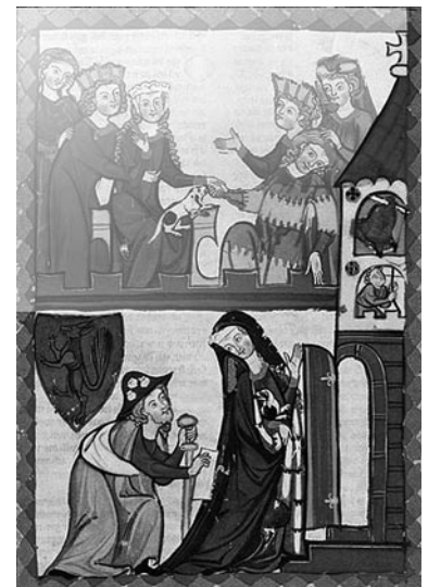
Hadlaub als Pilger verkleidet steckt seiner verehrten Dame vor dem Fraumünster sein Brieflein «von sender Klage» zu. Codex Manesse, fol. 371r. Um 1305. Universitätsbibliothek Heidelberg

Pilger, die in Zürich vorbeikamen, haben zweifellos nebst den Gräbern der Märtyrer Felix und Regula auch die Marienkapelle im Fraumünster mit dem Altar der Maria und der Heiligen Drei Könige, der Schutzheiligen der Pilger und Reisenden, aufgesucht. Es muss deren so viele gegeben haben, dass man als Pilger beim Fraumünster offenbar nicht auffiel. Sonst hätte sich der Zürcher Minnesänger Hadlaub nicht als solcher verkleidet, um der von ihm verehrten Frau heimlich sein Brieflein «von sender Klage» (voller Liebesklagen) zuzustecken, wie dies die abgebildete Miniatur aus der manessischen Liederhandschrift zeigt 6 .