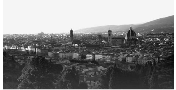
Abschied von Florenz vor der Basilika San Miniato al monte

Auf der Heimfahrt wird uns mit dem Baptisterium in Parma ein weiteres Kleinod geschenkt. Oft sind es die kleinen Dinge, die unsere Seele berühren: mir geht es so mit einem Engel von geradezu heiliger Einfachheit auf einem Relief mit der Flucht nach Ägypten, der mit grosser Gewissheit den Weg weist... Und plötzlich schwingt sich