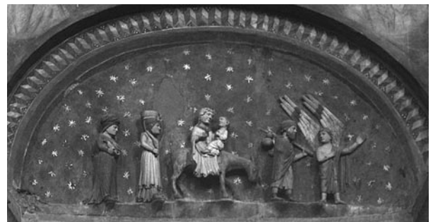
Im Baptisterium von Parma ..... Flucht nach Ägypten Flötenspieler von Vreni