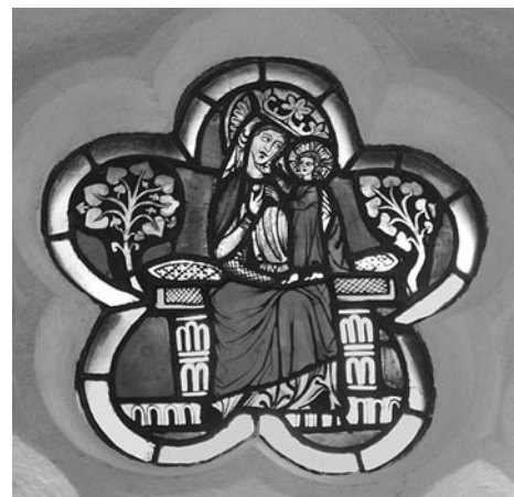
oben: Thronende Madonna mit Kind. Glasgemälde im Kreuzgang des Zisterzienserklosters Wettingen (um 1280/90).