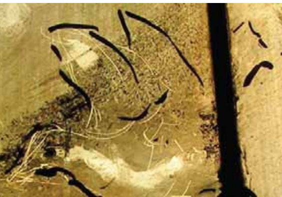
Taube – Symbol des Geistes – Detail aus Marc Chagalls Davids-Fenster