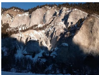
Startkaffee: Bahnhofrestaurant Sedrun

Auf der Hin- und Rückfahrt können wir die Morgen- und Abendstimmung in der Rheinschlucht erleben.